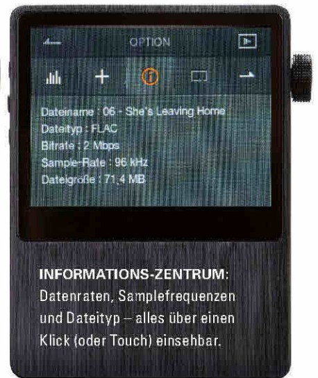
INFORMATIONEN-ZENTRUM: Datenraten, Samplefrequenzen und Dateityp – alles über einen Klick (oder Touch) einsehbar.

speicherkapazität für High-Res-Daten gescheitert wären, kann der AK 100 mit einem durch Micro-SD-Karten auf bis zu 96 GB erweiterbaren internen 32-GB-Flash-Speicher punkten. Der reicht für so einige Studio-Master-Aufnahmen völlig aus. Aber erst mit der entsprechenden Chip-Bestückung wird diese Datenflut adäquat kontrolliert. Im Astell&Kern arbeitet dazu ein höchst potenter Wolfson WM8740, der ebenso in den exzellenten kleineren Linn-Netzwerk-Playern wandelt und bei Bedarf auch anderen Zuspiegeln über den optischen Digitaleingang zur Verfügung steht. Der Akku-Laufzeit scheint's nicht zu schaden: Der AK 100 ließ im Praxistest an den Herstellerangaben (bis zu 16 Stunden) keine Zweifel aufkommen.