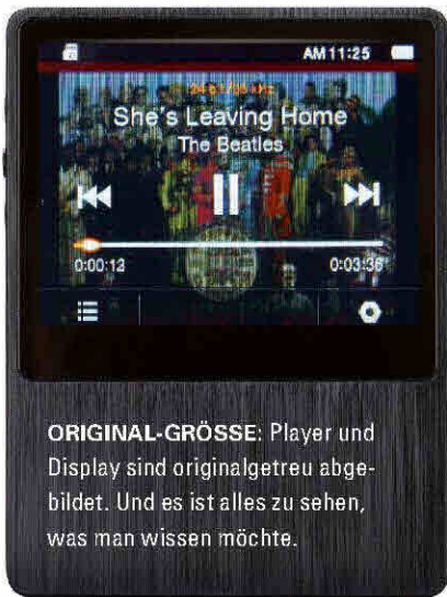
ORIGINAL-GRÖSSE: Player und Display sind originalgetreu abgebildet. Und es ist alles zu sehen, was man wissen möchte.